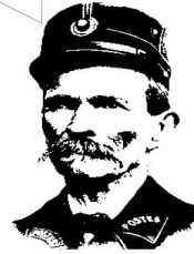
LE PALAIS IDEAL INVISIBLE

Si j'avais su qu'on pouvait faire des Palais idéaux invisibles je serais resté au lit