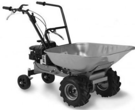
LE PALAIS IDEAL INVISIBLE Faites-le vous-même

POUR TRANSPORTER L'INVISIBLE IL EST RECOMMANDÉ D' UTILISER UNE BROUETTE ELECTRIQUE