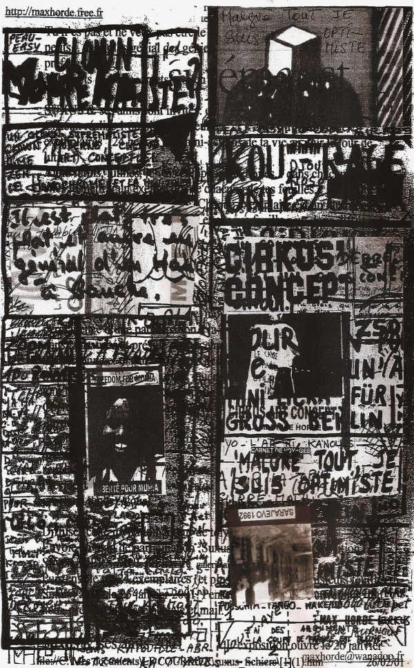
ART PEAU-EASY CIRKUS LINE SUPREMATIST' impression EROTIC' TYPO siempere!