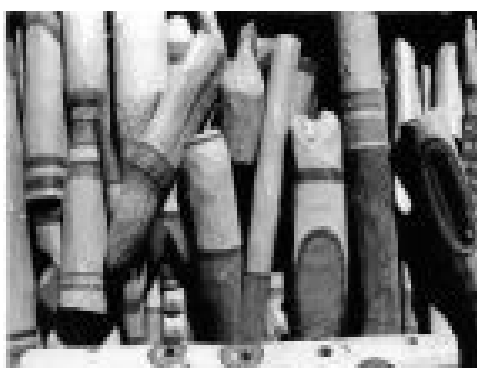
Bois taillé et peint. Le jeu du marchand. Toulouse .1970

La toute première expérience de communication directe que j'ai accomplie avec le public fut réalisée en 1970 autour de la cathédrale St Sernin, à Toulouse pendant les marchés au puces des dimanches et lundis.