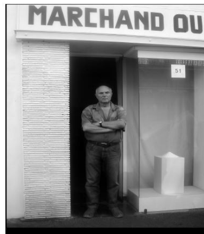
51 rue Pierre Sépard Sète